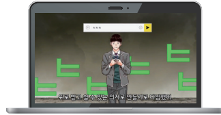
▲난 웃기만 했어요(중등용)