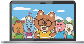
▲이런 것도 학교폭력인가요?(초등용)

학교폭력 예방교육 동영상 시청을 통해 학교폭력이 무엇인지, 학교폭력 문제에 대해 어떻게 행동해야 하는지를 학습할 수 있습니다.